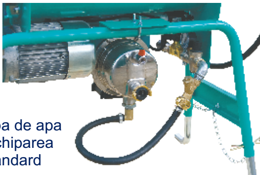
Pompa de apa in echiparea standard