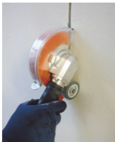
Crearea canalelor pentru cabluri electrice