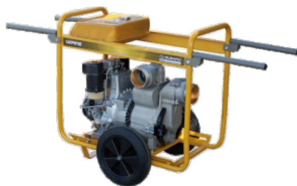
120 D versiune cu rezervor marit si roti