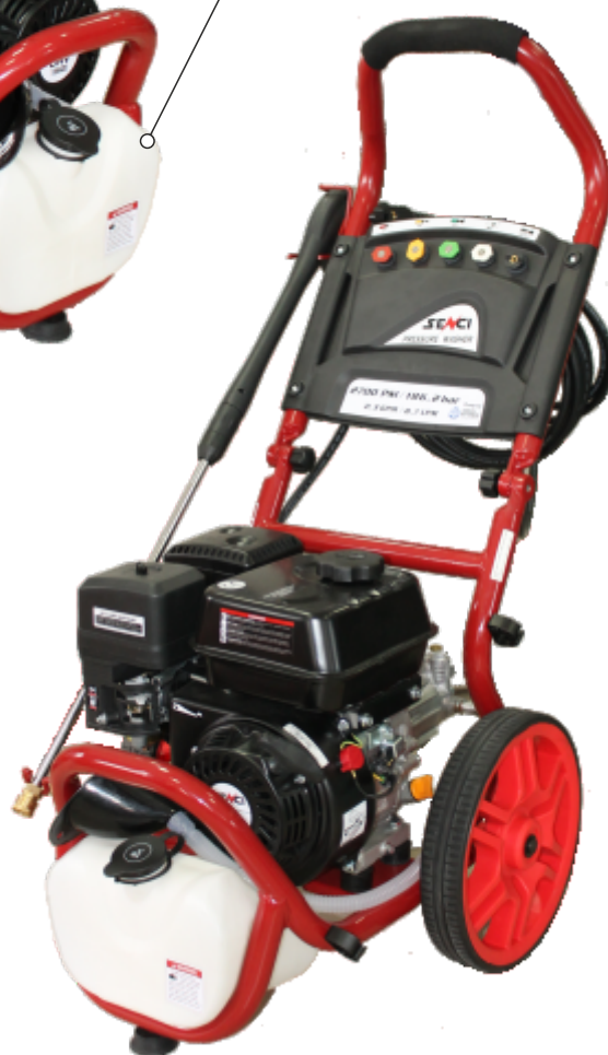
Recipient pentru detergent

Roti mari pentru a fi mai usor de transportat pe teren accidentat