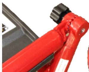
Manere pliabile, pentru depozitare si transport eficient