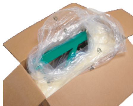
Mod ambalare si transport