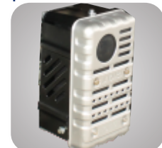
Esapament unic ce reduce zgomotul