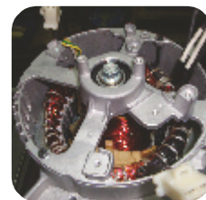
Alternator produs si patentat de Senci