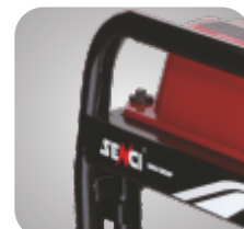
Cadru tratat pentru a preveni ruginirea