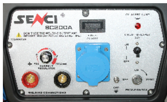
Panou de control