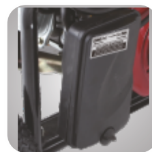
Filtru de aer patentat