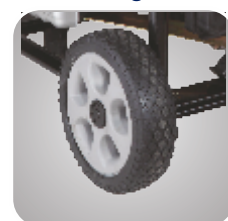
Kit roti si manere