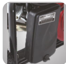
Filtru de aer patentat