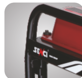
Cadru tratat pentru a preveni ruginirea