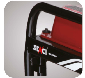
Cadru tratat pentru a preveni ruginirea