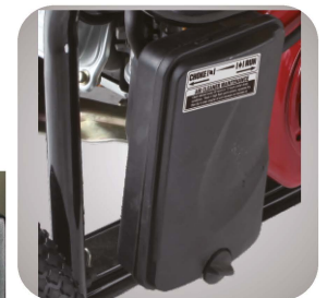
Filtru de aer patentat