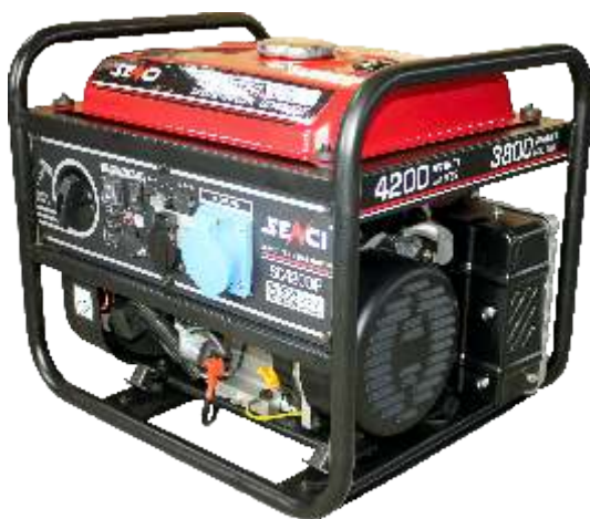
Priza cu 3 pini 1 x 230V 16.5A