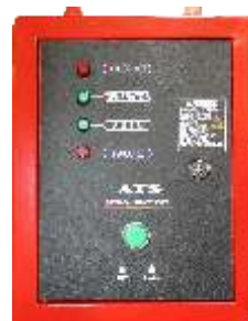
Panou ATS inclus in echiparea standard