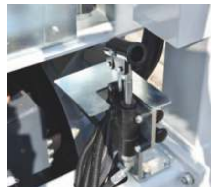
Dispozitiv de coborâre manuala stabilizatori