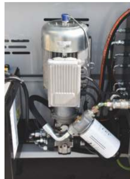
Unitate de alimentare cu curent alternativ