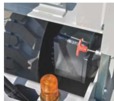
Control manual de coborâre de urgență a platformei