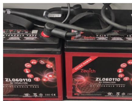
Compartiment pentru bateriile AGM