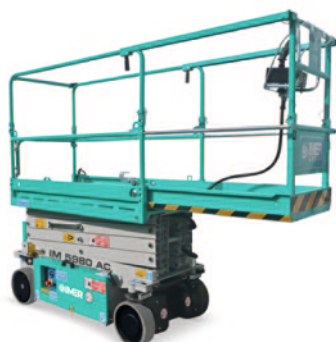
Extensie platforma 1 m