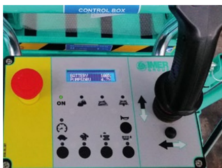
Panou de control detasabil cu butoane capacitive: simplitate si siguranta in utilizare