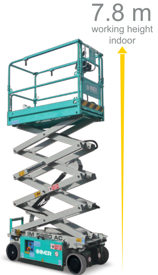
IM 5980 AC