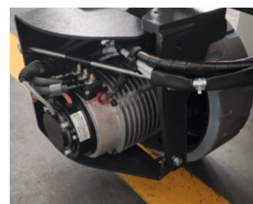
Motor electric AC; virare electrica pana la 90°