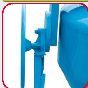
Ribaltamento a pignone e corona Piñon y corona de basculación