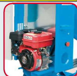
Modello con motore a combustione Modelo con motor de combustión