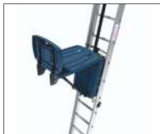
Platformă Standard Cod: GEDA65320