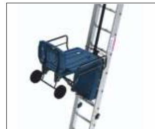
Platformă Premium Cod: GEDA65330