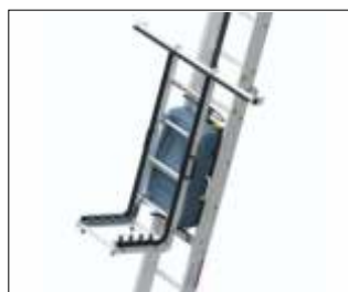
Platformă panouri solare BatteryLadderLift Cod: GEDA65364