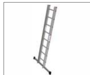
Tronson 2.400 mm BatteryLadderLift Cod: GEDA65220