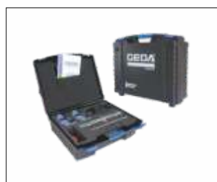
Geantă transport/depozitare Cod: GEDA65470