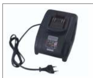
Încărcător acumulator 3.0A BatteryLadderLift Cod: GEDA65430