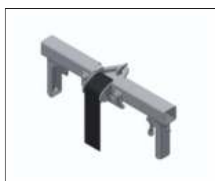
Secțiune terminală superioară BatteryLadderLift Cod: GEDA65410