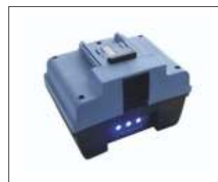
Acumulator 24V/10AH BatteryLadderLift Cod: GEDA65440