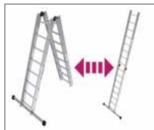
Tronson 4.500 mm BatteryLadderLift Cod: GEDA65210