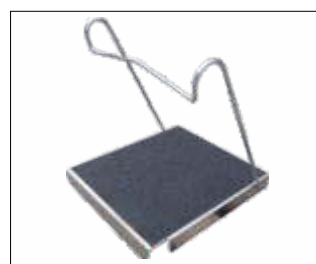
Hook-in step Cod: GEDA65530