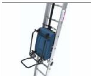
Platformă Basic Cod: GEDA65310