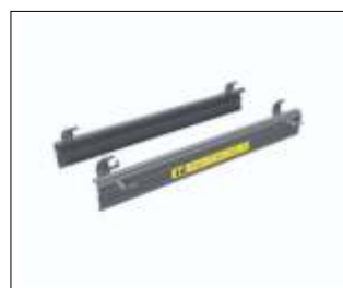
Kit conexiune tronsoane 4500-2400 BatteryLadderLift Cod: GEDA65230