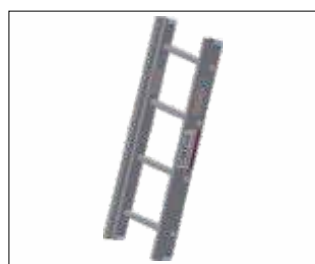
Tronson 1.100 mm Cod: GEDA65229