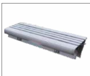
Step module Cod: GEDA65520