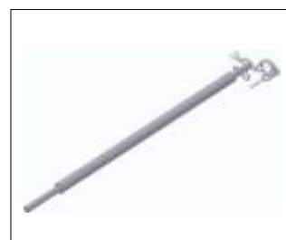
Bară terminală inferioară BatteryLadderLift Cod: GEDA65450